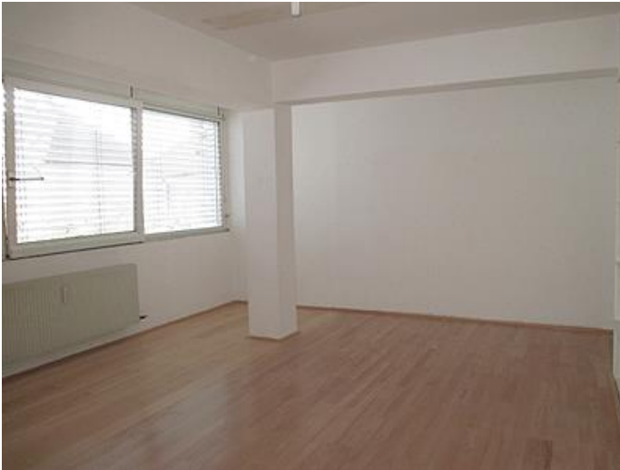
Büro südost 28,98 m 2