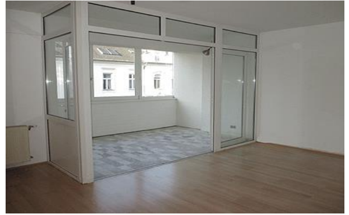
Loggia-Besprechungsraum, Büro süd 32,16 m 2