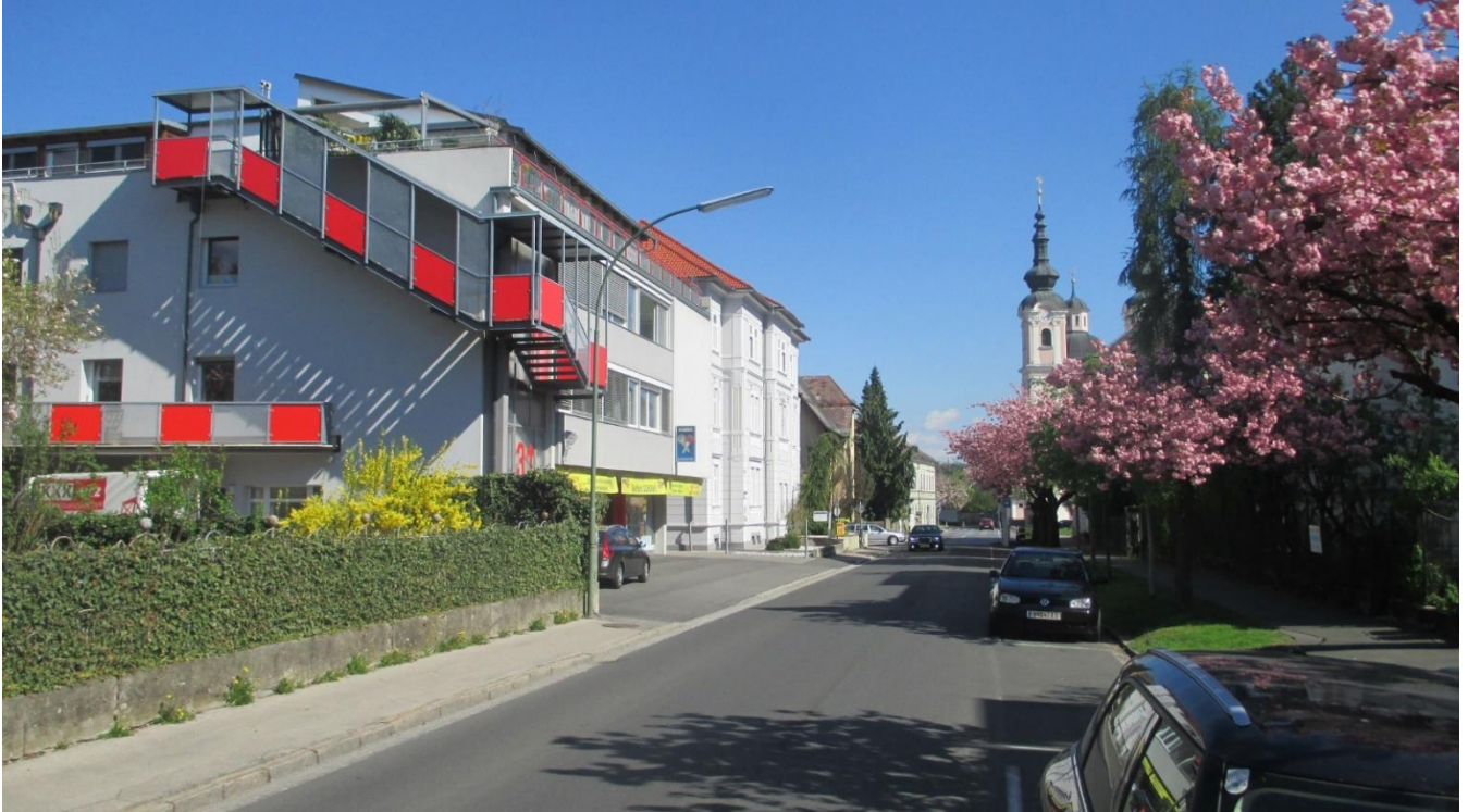
Peraustrasse, die Räumlichkeiten befinden sich im 2. Stock