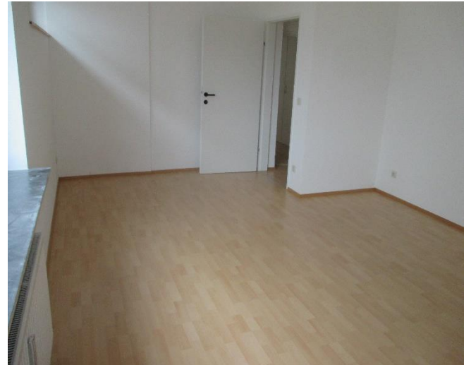
Büro nordost 22,12 m 2