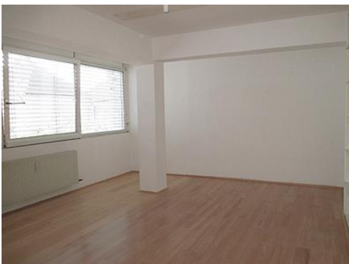
Raum Südostseite, 28,98 m 2