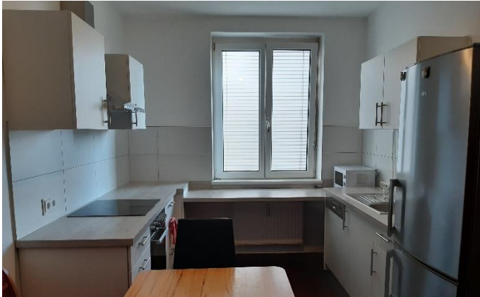
Kaffeeküche 10,82 m 2