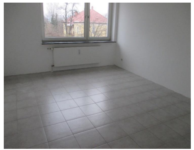
Büro nord, 16,14 m 2